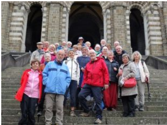
36. Le groupe sur les escaliers