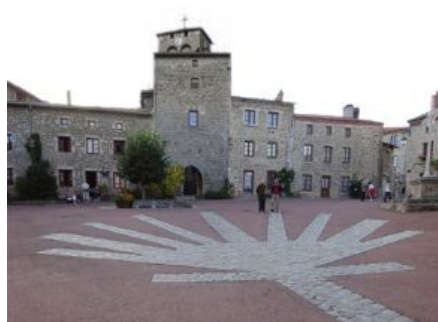
10. Coquille !