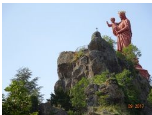
31. Notre Dame de France