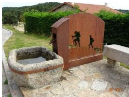
15. Fontaine devant l'Eglise