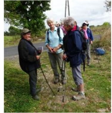
23, ... et son épouse.

Le village de Bellevue-la-Montagne, contrairement à ce que son nom pourrait laisser croire, est sinistré et semble déserté, mais il abrite une église refaite à neuf et un grand bistrot, qui nous accueille aimablement, nous et notre somptueux pique-nique. J'espère que le petit chat blanc qui miaulait derrière la vitrine de la boucherie fermée n'était pas abandonné. Tout au long du chemin, les monuments aux morts rappellent les pertes subies en 14-18. Je suis interpellée par les longues listes de ces jeunes hommes tombés au combat. Quatre, cinq du même nom, pour des petits villages de quelques centaines d'âmes. Depuis Bellevue, le chemin continue dans un paysage différent: des pins, des prés et de la pierre noire sur la route. L'arrivée par les hauteurs offre une très jolie vue sur Saint-Paulien et son église de basalte.