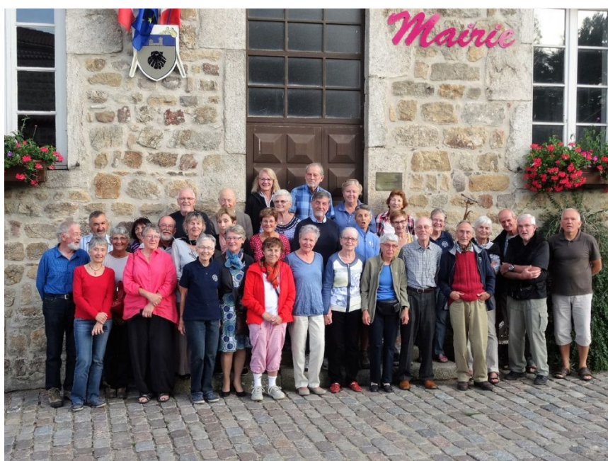
7. Le groupe devant la Mairie de Marols – notez la coquille sur les armoiries de Marols

Déjà 18'500 pas selon mon compteur. Objectif atteint !