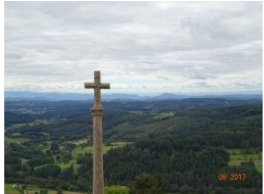
18b. Vue magnifique