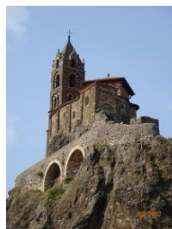
32. St-Michel d'Aiguilhe