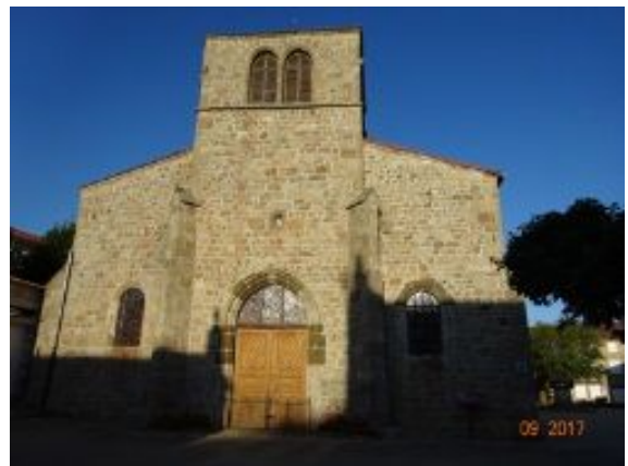
20. Eglise de Chomelix