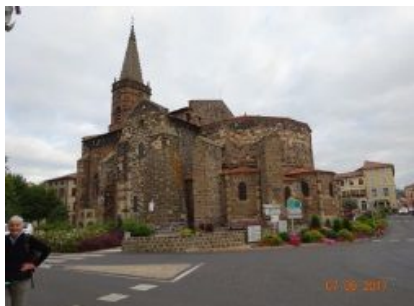
25. Eglise de St-Paulien

Nous entamons la journée par un Ulteira chanté dans l'abbatiale, et nous suivons un chemin sans grande particularité jusqu'à Billac, qui nous accueille pour notre méditation sur les Emotions négatives .