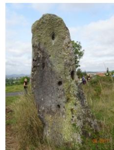
27. Pierres le long du chemin