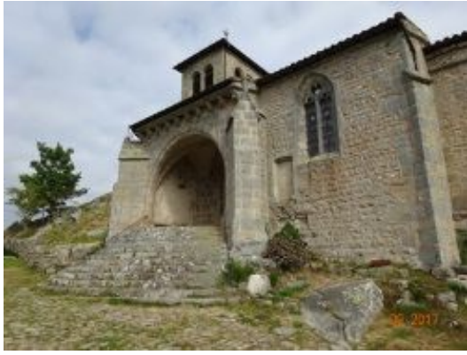
16. Eglise de Montarcher