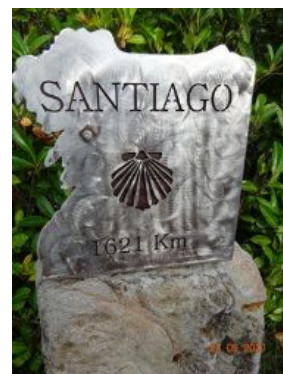
13. 1621 km !