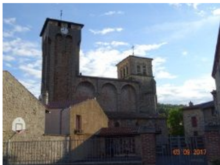
8. Eglise fortifiée de Marols