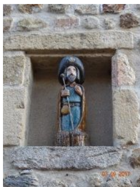
12. Et plus «classique».