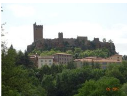
28. Polignac et son église (29)