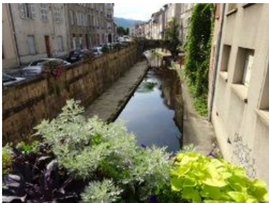
1. Le Vizézy à Montbrison

Dimanche matin, aéroport de Genève: nouvelle arrivée dans un groupe déjà constitué, je me sens un peu timide. Mais tout de suite je suis happée par des bras amicaux, et je me sens bien dans le car qui conduit notre petite troupe à Montbrison (Loire).