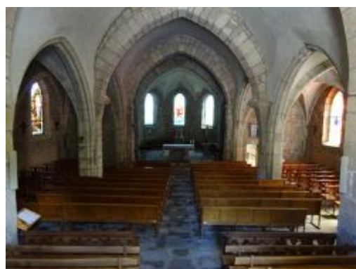
6. Particularité de cette église: Elle est construite en pente !