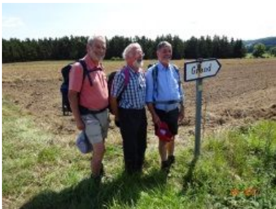
19. Frères et cousin Grand...

19 km pour atteindre Chomelix, à travers champs et forêts d'épineux. Nous nous arrêtons à Pontempeyrat pour méditer sur la dépendance et la codépendance . Pour la seule fois de la semaine nous mangeons en plein air. Le dessert se ramasse sur les mûriers abondants au bord du bois. En chemin, notre petite troupe fait fuir un magnifique troupeau de vaches d'Aubrac, dont nous aurions aimé admirer les yeux !. L'Auberge de l'Arzon, qui héberge la majorité du groupe, nous offre confort et un délicieux repas. Qui va oublier le dessert aux petits-fruits et sa glace à la verveine ?