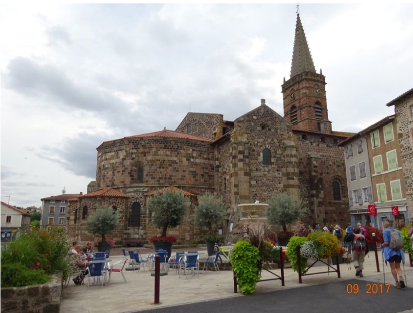
24. Eglise de basalte de St-Paulien

Le village de Bellevue-la-Montagne, contrairement à ce que son nom pourrait laisser croire, est sinistré et semble déserté, mais il abrite une église refaite à neuf et un grand bistrot, qui nous accueille aimablement, nous et notre somptueux pique-nique. J'espère que le petit chat blanc qui miaulait derrière la vitrine de la boucherie fermée n'était pas abandonné. Tout au long du chemin, les monuments aux morts rappellent les pertes subies en 14-18. Je suis interpellée par les longues listes de ces jeunes hommes tombés au combat. Quatre, cinq du même nom, pour des petits villages de quelques centaines d'âmes. Depuis Bellevue, le chemin continue dans un paysage différent: des pins, des prés et de la pierre noire sur la route. L'arrivée par les hauteurs offre une très jolie vue sur Saint-Paulien et son église de basalte.