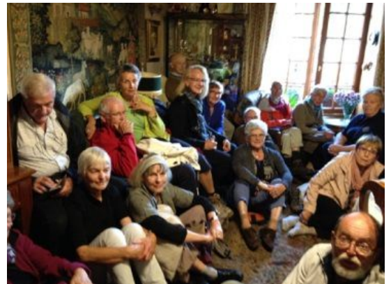
38. Chacun trouve une petite place...