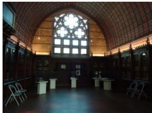
2. Salle Héraldique de la Diana

En fin d'après-midi, une guide fort cultivée, à travers une visite de cette cité historique mentionnée dès la fin du XI e siècle, nous ouvre les portes du comté du Forez, dont l'histoire nous suivra toute la semaine.