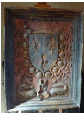
3. Blason aux multiples coquilles !