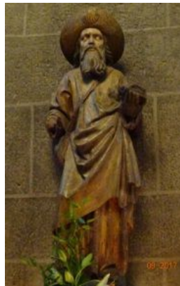
37. Saint Jacques