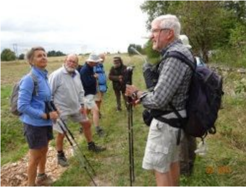
21. Rencontre avec un vieux fermier...