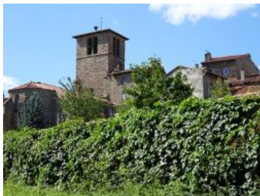
5. Eglise de Saint-Jean-Soleymieux, Notre Dame des Fièvres