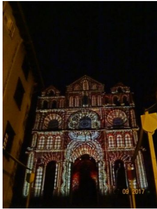
33. La Cathédrale

Le soir, nous assistons au spectacle nocturne Puy de Lumières .