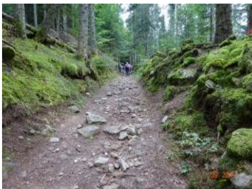
14. La voie Bolène vers Montarcher

Toujours accompagnés d'un temps favorable, nous marchons sur la Voie Bolène jusqu'à la place-forte de Montarcher, plus haute commune de la Loire, qui culmine à 1162 m. De la plateforme située vers l'ancien donjon, par bonne visibilité, on peut apercevoir les Alpes et le Mont-Blanc. La méditation Nos croyances et nos habitudes, comme frein au lâcher-prise se fait dans l'église Notre-Dame, connue pour ses fresques du XIIIe siècle. Et Bernard nous offre un petit concert de cor des alpes, parfaitement adapté à la vision des lointaines montagnes. La mairie nous accueille pour le repas dans une salle toute moderne. Tout au long du chemin j'admire le fonctionnement de l'administration française. Une mairie pour 68 habitants ! L'après-midi nous conduit à Usson-en-Forez, gros bourg agricole. L'histoire du comté nous poursuit !