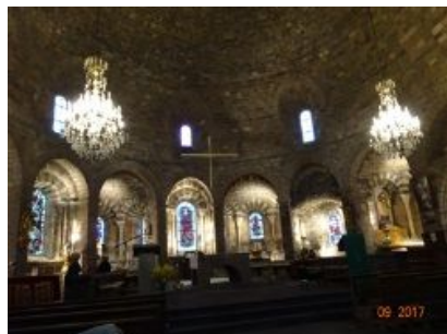
26. Coupole à l'intérieur