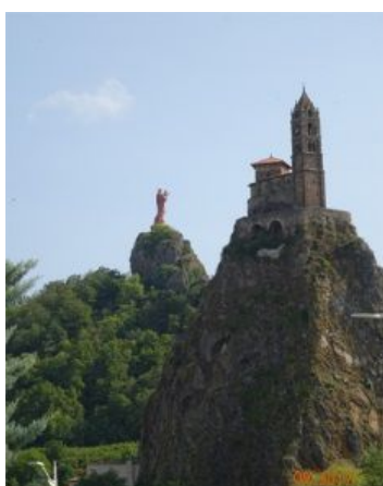
30. Arrivée au Puy-en-Velay

De là nous marchons à travers champs et prairies jusqu'au Puy-en-Velay. Nous montons à travers la vieille ville jusqu'au Grand séminaire St Georges, où nous logerons deux nuits. Malgré l'étroitesse des rues, la circulation automobile n'est pas interdite. Les habitants sont des pros du démarrage en côte !