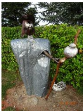
11. St-Jacques moderne !